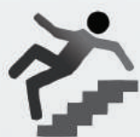
Ubezpieczenia od wypadków